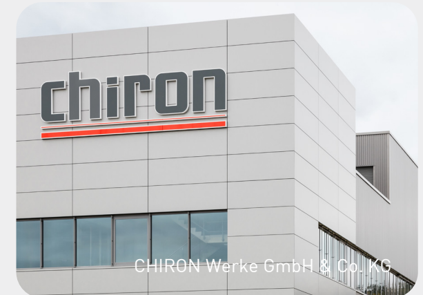
CHIRON Werke GmbH & Co. KG