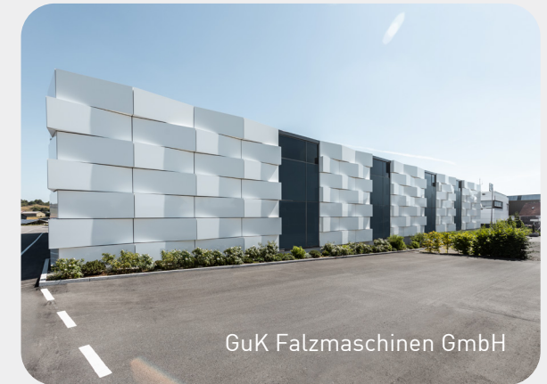
GuK Falzmaschinen GmbH