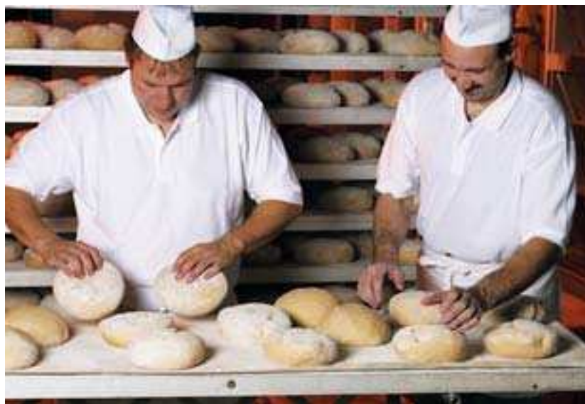
Auf Qualität wird in der Backstube bei Krachenfels gesetzt.

Bier und alkoholfreie Getränke werden bevorzugt aus regionaler Herstellung sowie überwiegend in Mehrwegverpackungen angeboten. Die Getränkemarktkette leistet damit einen wichtigen Beitrag zum Umweltschutz. Ein übersichtlicher Warenaufbau und breite Gänge im Markt ermöglichen einen bequemen und raschen Einkauf. Unter dem Namen „Vitaperle“ bietet Frito eine Eigenmarke im Bereich Mineralwasser und Wasser mit Aroma an. Die Märkte werden generell von selbstständigen Partnern betrieben, die den persönlichen Kontakt zum Kunden pflegen. Außer in neun Bundesländern ist die Kette auch im österreichischen Tirol vertreten. krü