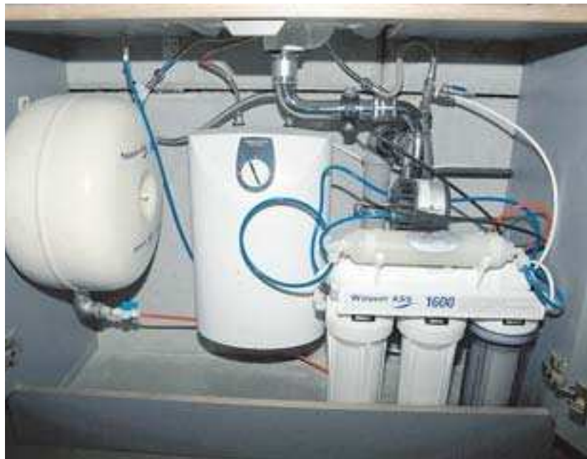
Wasser-ASS-Anlage für den Haushalt, passend unter jeden Spültisch.

Herzlichen Glückwunsch zum gelungenen Neubau – Ausführung der Erd-, Beton und Maurerarbeiten