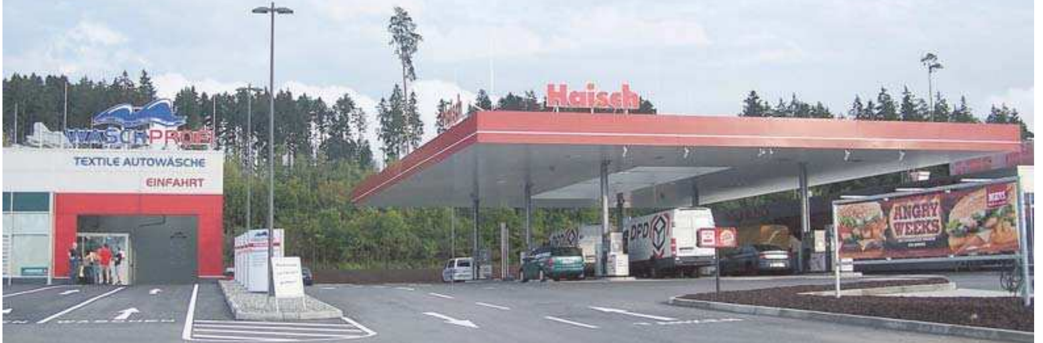
Die neue Tankstelle am Messekreisel gehört zur Haisch-Gruppe und zeigt dies auch deutlich an.

Heute Eröffnung mit Bewirtung und Programm / Tankstelle, Shop, Waschanlage und Burger-King