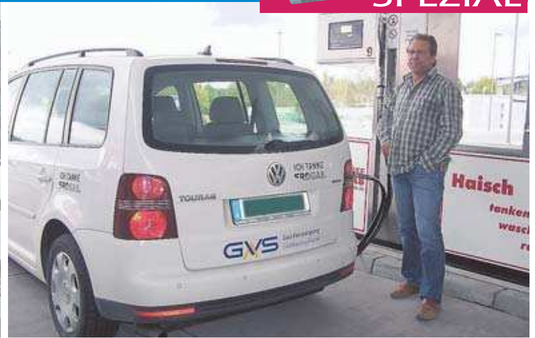
Der Kompressorraum und der Tankplatz der neuen und von den Stadtwerken VS installierten Erdgaszapfstelle am Messekreisel in der Dürrheimer Straße 57.