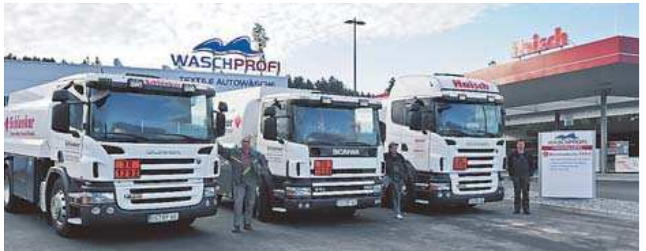
Die Tanklastzüge der Schlenker Schwarzwälder-Brennstoffhandel-GmbH.

Nach dem Schlenker-Grün in der Güterstraße präsentiert sich nun der neue Standort also in Haisch-Rot. In der neuen Textil-Waschstraße beispielsweise werden die Kunden aber weiterhin bekannte Gesichter wiederfinden. So auch die gute Seele